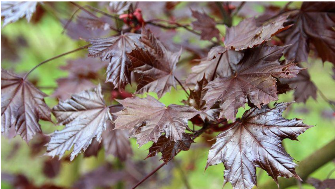
Skogslönn Royal Ruby