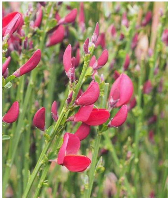
Hollänsk ginst 'Boskoop Ruby'