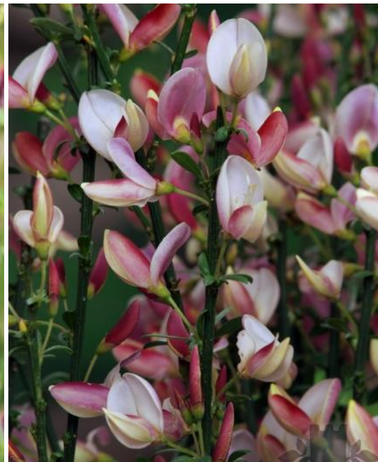
Hollänsk ginst 'Hollandia'